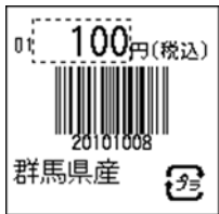
116_JAN8_税込価格_4桁連動_1行_プラ