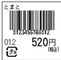
127_JAN13_税込価格(下)_連動無_プラ