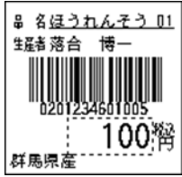
121_JAN13_4桁価格連動(PC付)_品名_産地_生産者