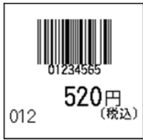
103_JAN8_税込価格(下)_連動無