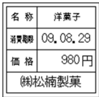
161_期限表示_名称_価格_ _社名