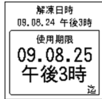
157_解凍日時使用期限ﾌﾗ 1