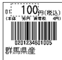
147_JAN13_総額表示_4桁 連動(PC付)