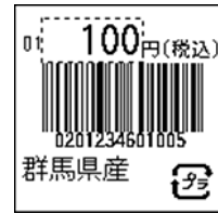
139_JAN13_税込価格_4桁 連動(PC付)_ﾌﾗ