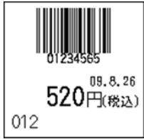
106_JAN8_税込価格(下)_連動無_日付入