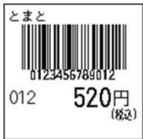
126_JAN13_税込価格(下)_連動無