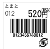
134_JAN13_税込価格(上)_連動無_紙