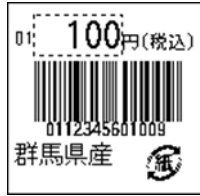
143_JAN13_税込価格_4桁 連動_紙