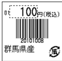
117_JAN8_税込価格_4桁連動_1行_紙