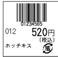
105_JAN8_税込価格(下)_連動無_1行_紙