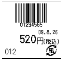
108_JAN8_税込価格(下)_連動無_日付入_紙