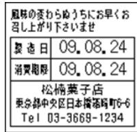
158_期限表示_製造日_社 名