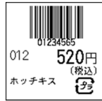
104_JAN8_税込価格(下)_連動無_1行_プラ