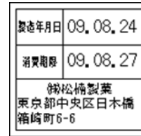
159_期限表示_製造年月日 _社名