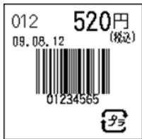
113_JAN8_税込価格(上)_連動無_日付入_プラ