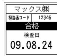
169_担当者コード検査日