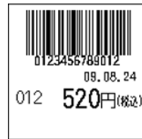
129_JAN13_税込価格(下)_連動無_日付入