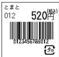
133_JAN13_税込価格(上)_連動無_プラ