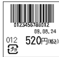
130_JAN13_税込価格(下)_連動無_日付入_プラ