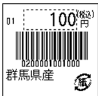
146_JAN13_税込価格_5桁 連動_紙