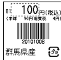
119_JAN8_総額表示_4桁連動_1行_プラ