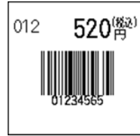
109_JAN8_税込価格(上)_連動無_1行