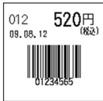
112_JAN8_税込価格(上)_連動無_日付入