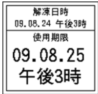
156_解凍日時使用期限ﾌﾗ 2