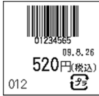
107_JAN8_税込価格(下)_連動無_日付入_プラ