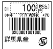
155_JAN13_総額表示_5桁 連動_紙