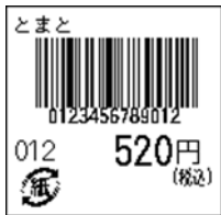
128_JAN13_税込価格(下)_連動無_紙