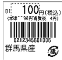
152_JAN13_総額表示_4桁 連動_紙