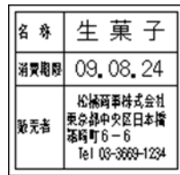
162_期限表示_名称_社名