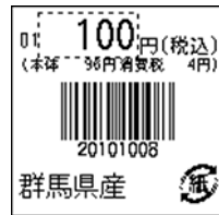
120_JAN8_総額表示_4桁連動_1行_紙