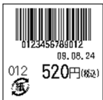
131_JAN13_税込価格(下)_連動無_日付入_紙