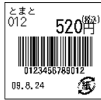
137_JAN13_税込価格(上)_ 連動無_日付入_紙