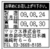
163_製造日賞味期限製造 者3231