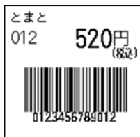
132_JAN13_税込価格(上)_連動無