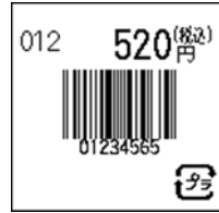
110_JAN8_税込価格(上)_連動無_1行_プラ