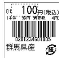
149_JAN13_総額表示_4桁 連動(PC付)_紙