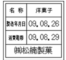
160_期限表示_製造年月日 _名称_社名