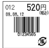
114_JAN8_税込価格(上)_連動無_日付入_紙