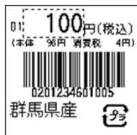
148_JAN13_総額表示_4桁 連動(PC付)_ﾌﾗ