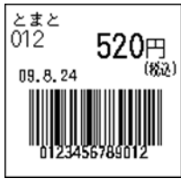
136_JAN13_税込価格(上)_ 連動無_日付入_ﾌﾗ