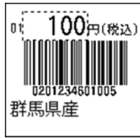
138_JAN13_税込価格_4桁 連動(PC付)