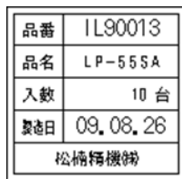
168_他_名称_入数_日付_ _社名