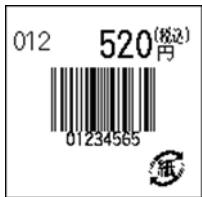
111_JAN8_税込価格(上)_連動無_1行_紙