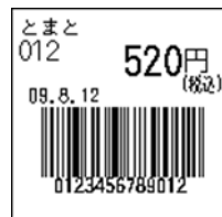
135_JAN13_税込価格(上)_連動無_日付入