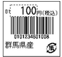
140_JAN13_税込価格_4桁 連動(PC付)_紙